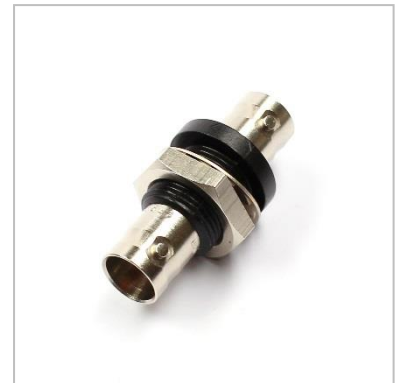
Gerätekupplung mit Sechskantmutter