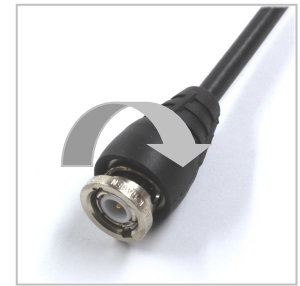
Kabelstecker mit Kupplungsstülle für Komfortables Kuppeln

Zubehör (gesondert zu bestellen): Knickschutzüllen Kupplungsstüllen für Kabel-Ø 5 mm