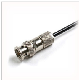
Kabelstecker Löt-/Klemmanschluss mit zusätzlicher Kabelzugentlastung

Die Ausführung mit Löt-/Klemmanschluss kann zusätzlich mit einem Klemmkonus für den Kabelmantel versehen werden und ermöglicht somit eine höhere Kabelzugentlastung 2 .